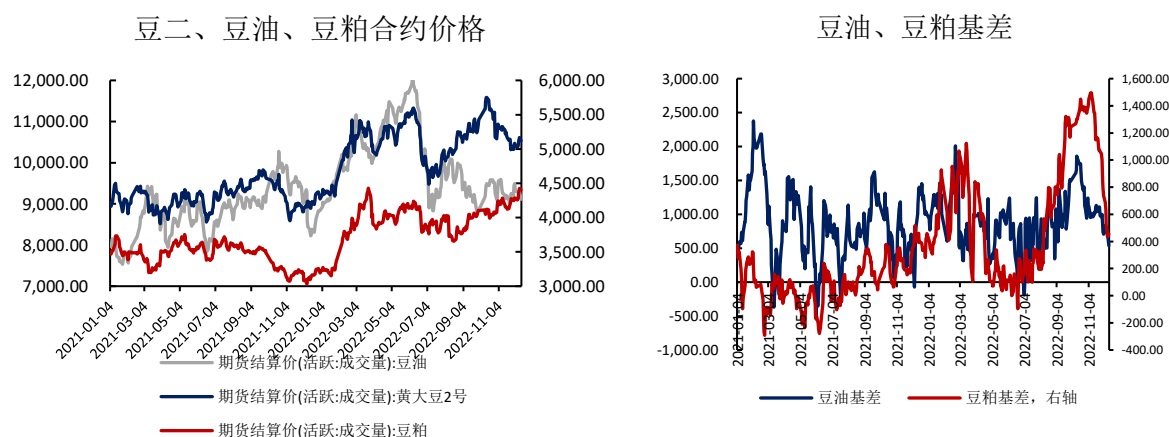
图表 5: 豆油、豆粕价基差 (元/吨)