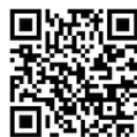
上交所投资者教育网站