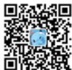
上交所投教微信公众号