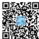
上交所投教微信公众号