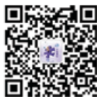
上交所期权之家微信公众号