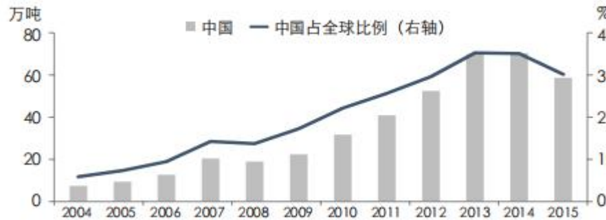
2004~2015年我国原生镍产量