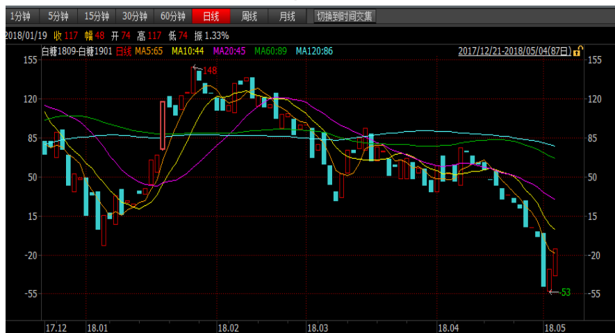
图 1: 郑糖 9-1 价差