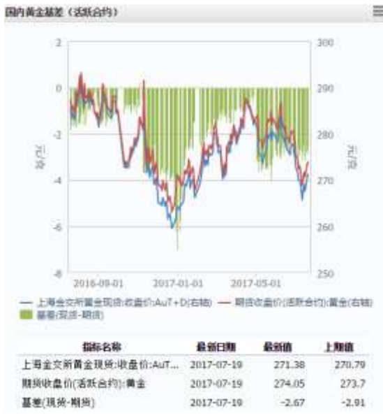
图 1 国内黄金基差