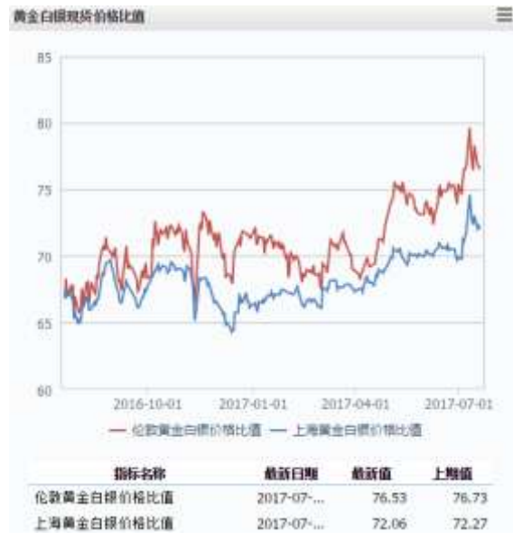
图 2 黄金白银现货价格比值