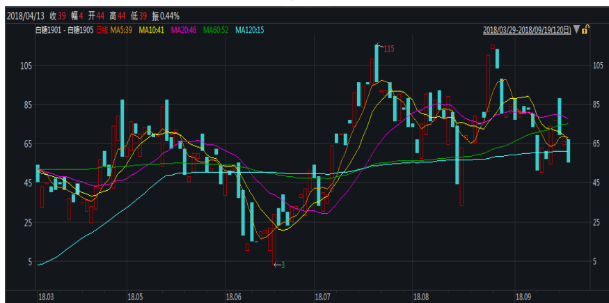
图 1: 郑糖 1-5 价差