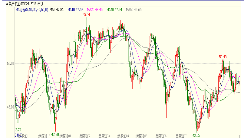
图 1:WTI 原油期货主力合约日线图