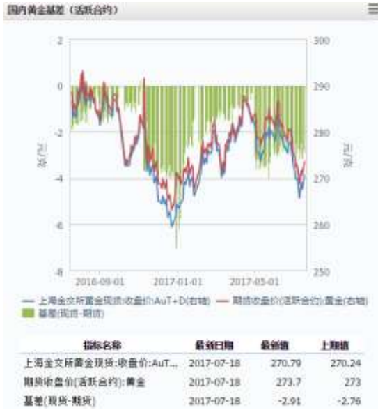
图 1 国内黄金基差