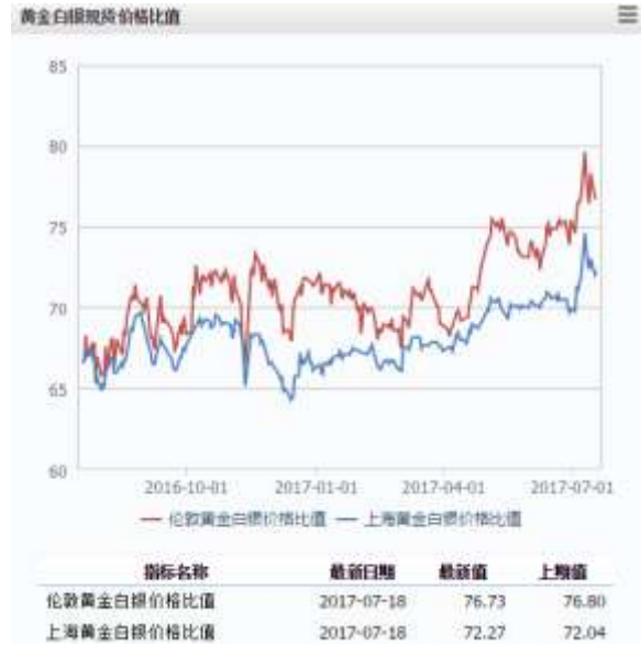
图 2 黄金白银现货价格比值