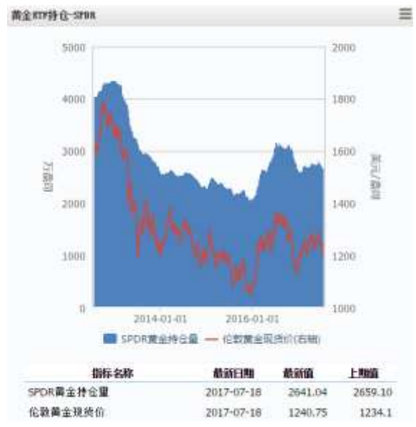
图 4 黄金 ETF-SPDR 持仓